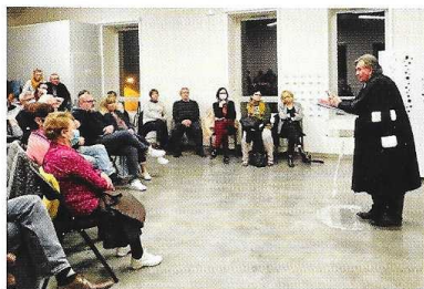
Garons Mag - Avril 2022